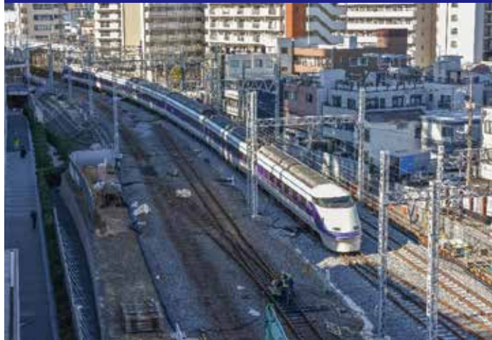
とうきょうスカイツリー駅部 切替工事後の状況