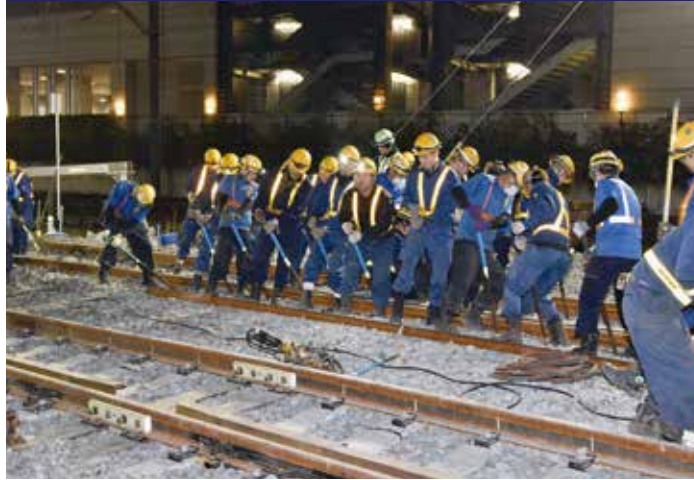
曳舟～とうきょうスカイツリー間 線路切替状況