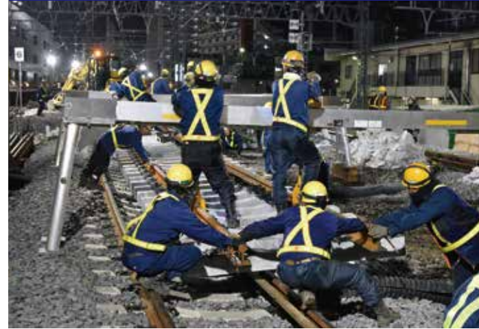
曳舟～とうきょうスカイツリー間 軌道新設状況