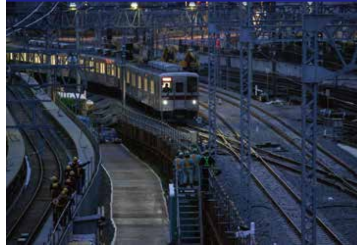
曳舟～とうきょうスカイツリー間 試運転列車走行状況