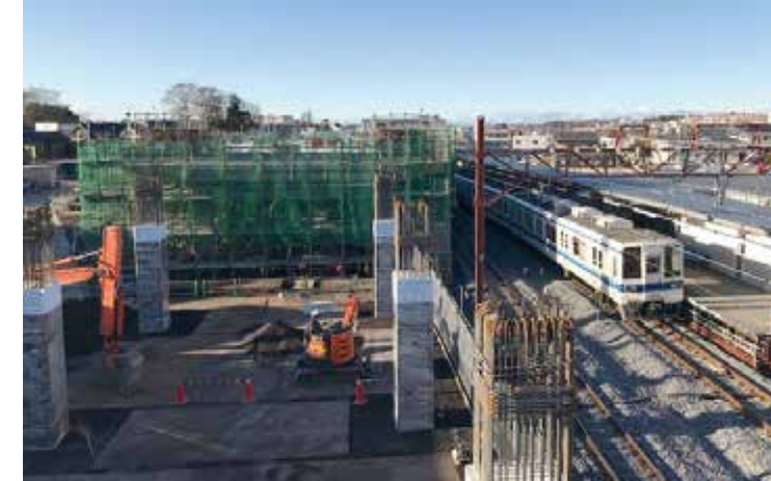
愛宕駅部 高架橋施工状況