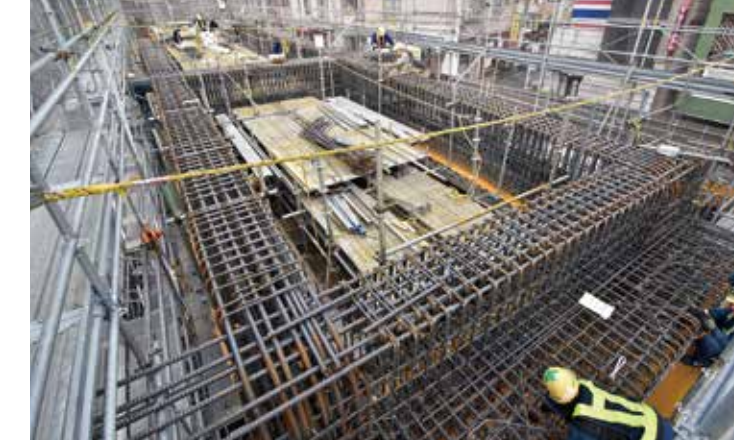
高架橋新設工事(床スラブ鉄筋)