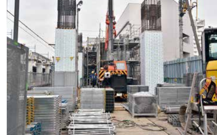
高架橋新設工事(高架橋橋脚)